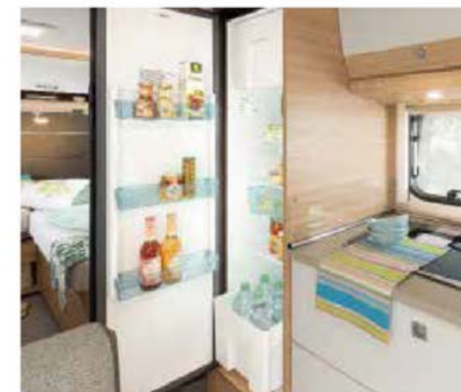
+ Großer 142-l-Kühlschrank mit 15-l-Frosterfach