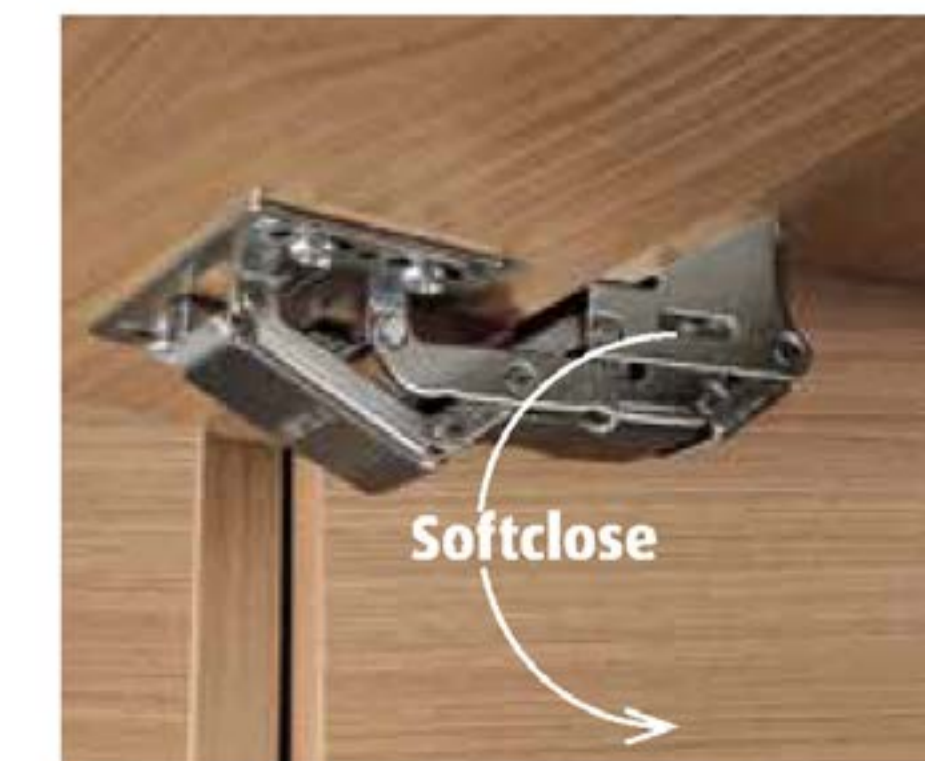
+ Weit öffnende Softclose-Scharniere