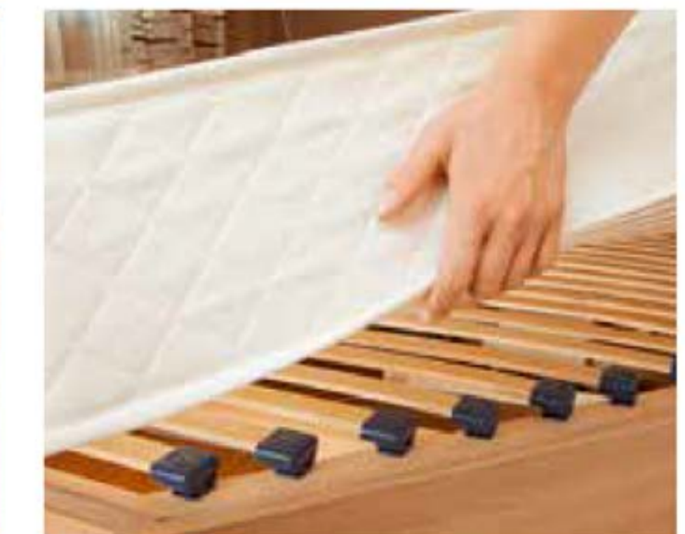
+ Perfekter Schlafkomfort dank des SchlafGut-Systems