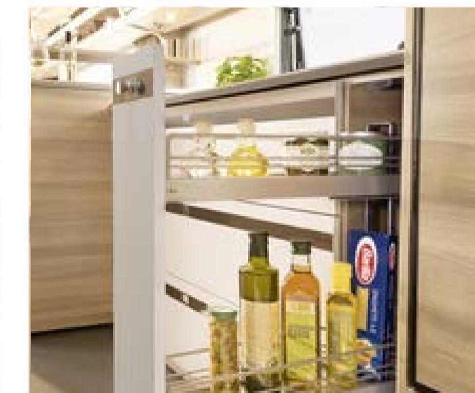
+ Gourmet-Küche mit praktischem Apotheker-Flaschenauszug